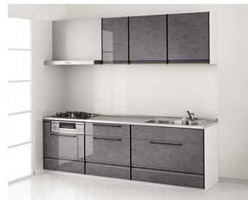
※写真の扉カラーは、グループ1：コンクリートグレーです。