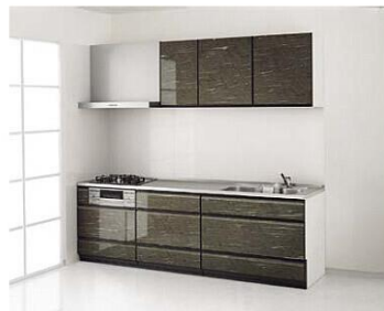
※写真の扉カラーは、グループ1：ブラウンシルクです。