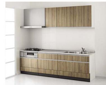
※写真の扉カラーは、グループ1：ヒッコリーミディアムです。