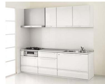
※写真の扉カラーは、ホワイトです。